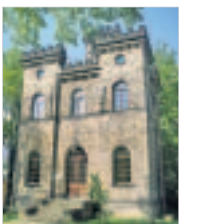
Belvedere „Schöne Höhe“ in Dittersbach

■ Informationen zu Trauungen im Belvedere „Schöne Höhe“ gibt es im Standesamt Dürrensdorf-Dittersbach, ☎035026 97528.